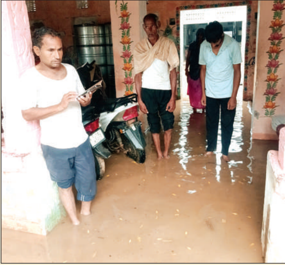
संबंधित विभाग और प्रशासन स्थायी समाधान की दिशा में कोई ठोस कदम नहीं उठाते। हर बार केवल आश्वासन दिए जाते हैं, जबकि जमीनी स्तर पर स्थिति जस की तस बनी रहती है। पहली

को घंटों तक पानी निकालने के लिए मशक्कत करनी पड़ी। ग्रामीणों ने बताया कि बरसात शुरू होने से पहले न तो नालियों की समुचित सफाई कराई गई और न ही उनकी मरम्मत पर ध्यान दिया गया। कई स्थानों पर नालियां कचरे और मिट्टी से पूरी तरह जाम पड़ी थीं। बारिश शुरू होते ही पानी की निकासी रुक गई और पूरा पानी गलियों से होता हुआ लोगों के घरों में घुस गया। महिलाओं, बुजुर्गों और बच्चों को सबसे अधिक परेशानी का सामना करना पड़ा। ग्रामीणों का कहना है कि यह समस्या कोई नई नहीं है। पिछले कई वर्षों से प्रत्येक मानसून में गांव के कई मोहल्लों में जलभराव की स्थिति बन जाती है, लेकिन