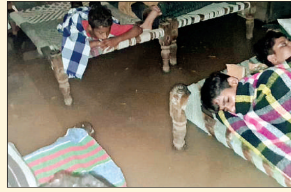
हो बारिश में जलभराव होने से ग्रामीणों में प्रशासन के प्रति गहरा रोष देखने को मिला। ग्रामीणों ने आरोप लगाया कि हाल ही में बनी सड़क का स्तर पहले की तुलना में काफी ऊंचा कर दिया गया, लेकिन उसके अनुरूप नालियों का निर्माण या

आवश्यक वस्तुएं भी भौंगकर खराब हो गईं। समस्या से परेशान ग्रामीणों ने पंचायत समिति कोटखावदा के अधिकारियों और प्रशासन को ज्ञापन सौंपकर गांव में नालियों के पुनर्निर्माण, नियमित सफाई तथा जल निकासी की समुचित व्यवस्था सुनिश्चित करने की मांग की है। ग्रामीणों ने कहा कि यदि समय रहते प्रभावी कदम नहीं उठाए गए तो आगामी दिनों में होने वाली तेज बारिश से स्थिति और गंभीर हो सकती है। लगातार जलभराव से मकानों की नींव कमजोर होने का खतरा भी बढ़ गया है, जिससे भविष्य में बड़े नुकसान की आशंका बनी हुई है। ग्रामीणों ने प्रशासन से मांग की है कि गांव का सर्वे कराकर जल